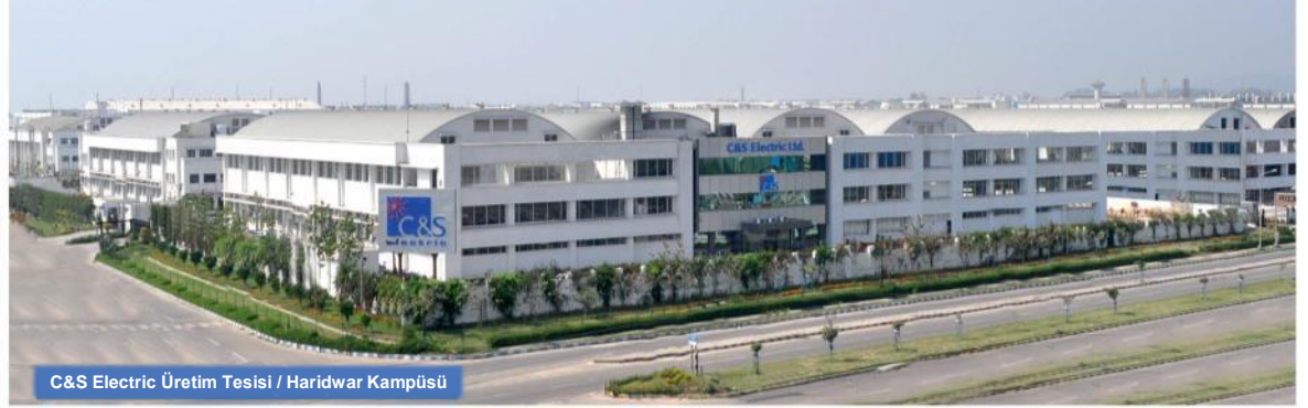
C&amp;S Electric Üretim Tesisi / Haridwar Kampüsü