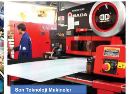
Son Teknoloji Makineler