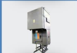
12kV, 17.5kV, SF6 Gazlı, Dış Mekan için RMU