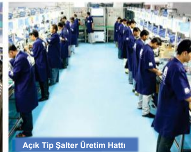
Açık Tip Şalter Üretim Hattı