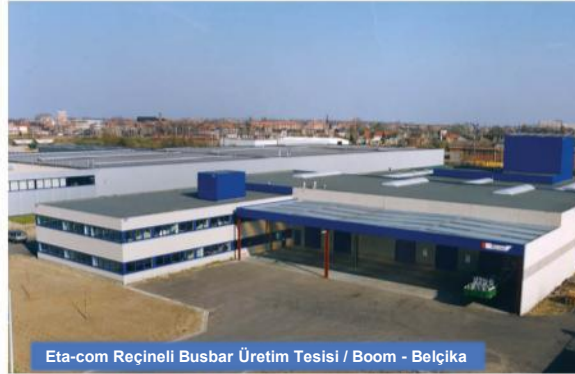
Eta-com Reçinelik Busbar Üretim Tesisi / Boom - Belçika