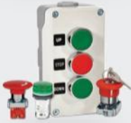
Kumanda ve Sinyal Cihazları