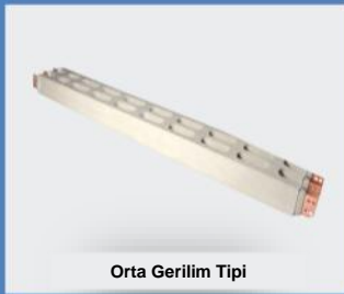
Orta Gerilim Tipi