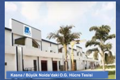
Kasna / Büyük Noida'daki O.G. Hücre Tesisi