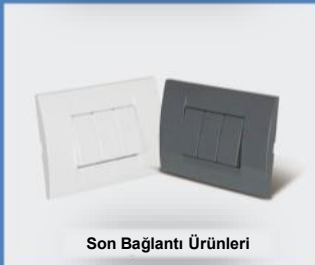
Son Bağlantı Ürünleri