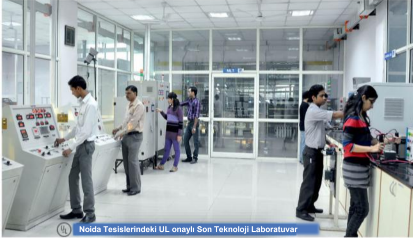
Noida Tesislerindeki UL onaylı Son Teknoloji Laboratuvar