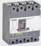
WINbreak1 Kompakt Şalter