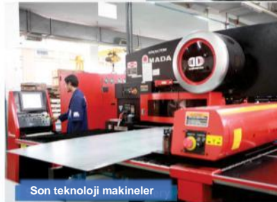
Son teknoloji makineler