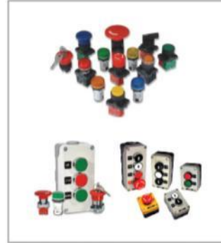
KUMANDA VE SINYAL EKİPMANLARI