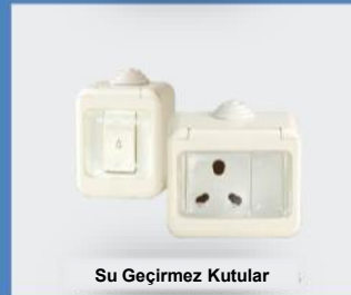
Su Geçirmez Kutular

Hindistan'ın en yüksek binalarında C&S WINtrip ürünleri kullanılmaktadır