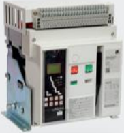
WINmaster2 Açık Tip Şalter