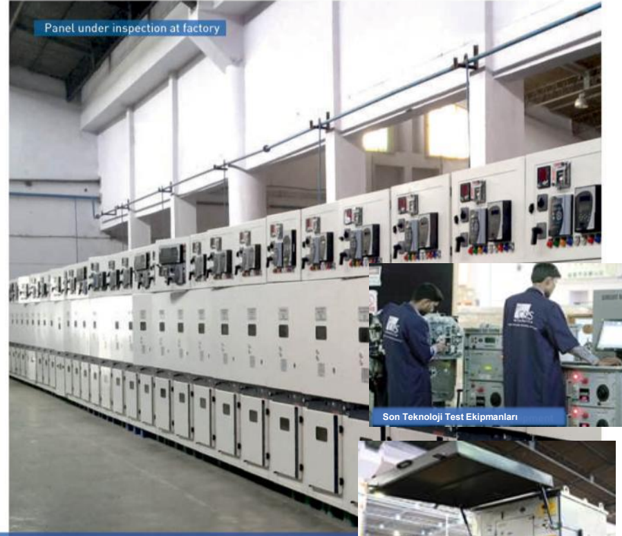
Panel under inspection at factory