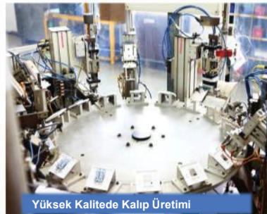
Yüksek Kalitede Kalıp Üretimi