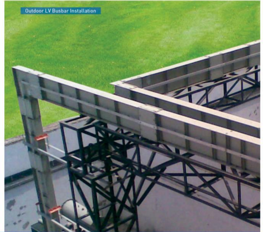
Outdoor LV Busbar Installation