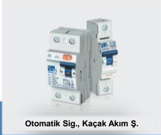
Otomatik Sig., Kaçak Akım Ş.