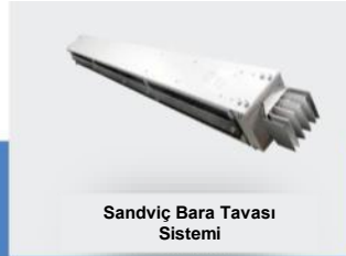
Sandviç Bara Tavası Sistemi