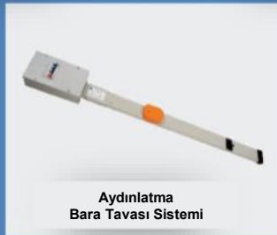
Aydınlatma Bara Tavası Sistemi