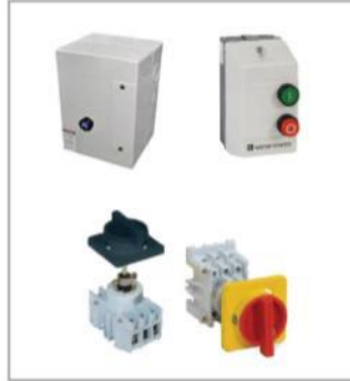
MOTOR KONTROL ÜNİTESİ & MOTOR YOL VERİCİLER