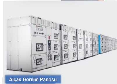
Alçak Gerilim Panosu