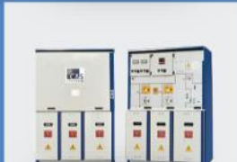
12kV, 17.5kV, SF6 Gazlı, İç&Dış Mekan için RMU