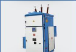
36kV Hava Yalıtımlı Kiosk