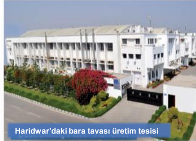
Haridwar'daki bara tavası üretim tesisi