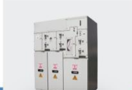
12kV, 24kV SF6 Gazlı, İç&Dış Mekan için RMU