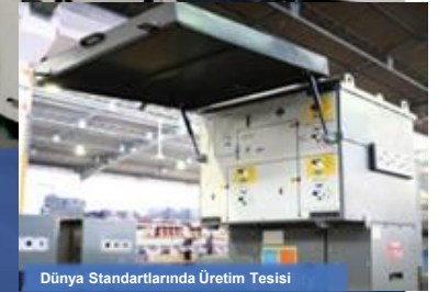
Dünya Standartlarında Üretim Tesisi