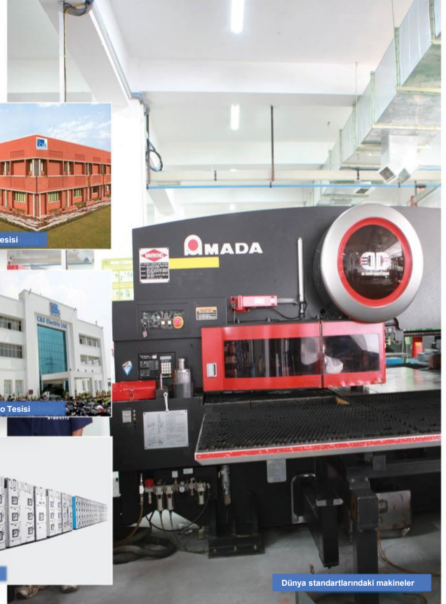
Dünya standartlarındaki makineler