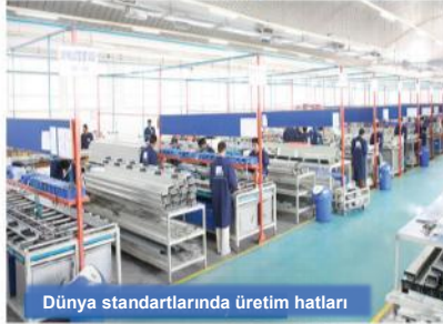
Dünya standartlarında üretim hatları