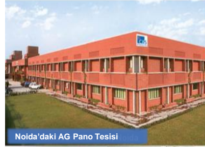
Noida'daki AG Pano Tesisi