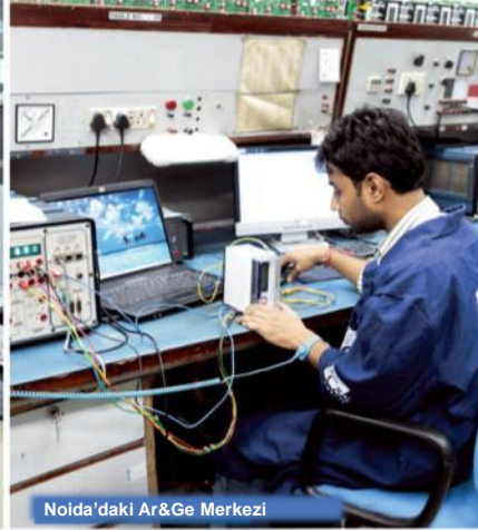
Noida'daki Ar&Ge Merkezi