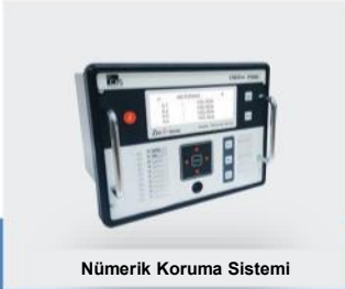
Nümerik Koruma Sistemi