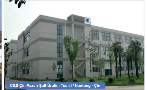
C&amp;S Çin Pazarı Şalt Üretim Tesisi / Nantong - Çin