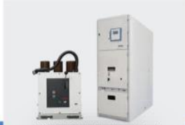
12kV, 24kV Hava Yalıtımlı, Çekmeceli, VCB'li Hücre