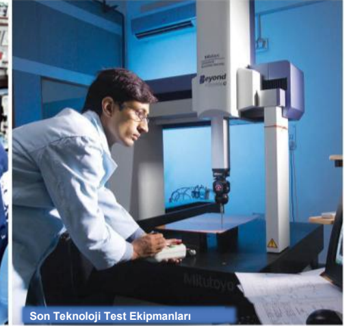
Son Teknoloji Test Ekipmanları