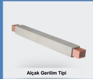
Alçak Gerilim Tipi