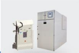
36kV Hava Yalıtımlı, Çekmeceli, VCB'li Hücre