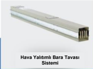
Hava Yalıtımlı Bara Tavası Sistemi