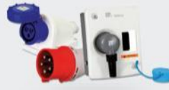
Endüstriyel Soket ve Fişler