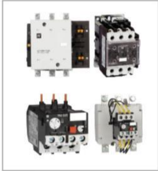
MANYETİK KONTAKTÖR & TERMİK RÖLELER