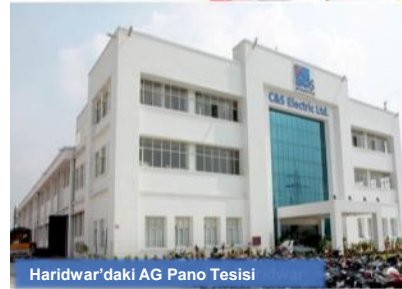
Haridwar'daki AG Pano Tesisi