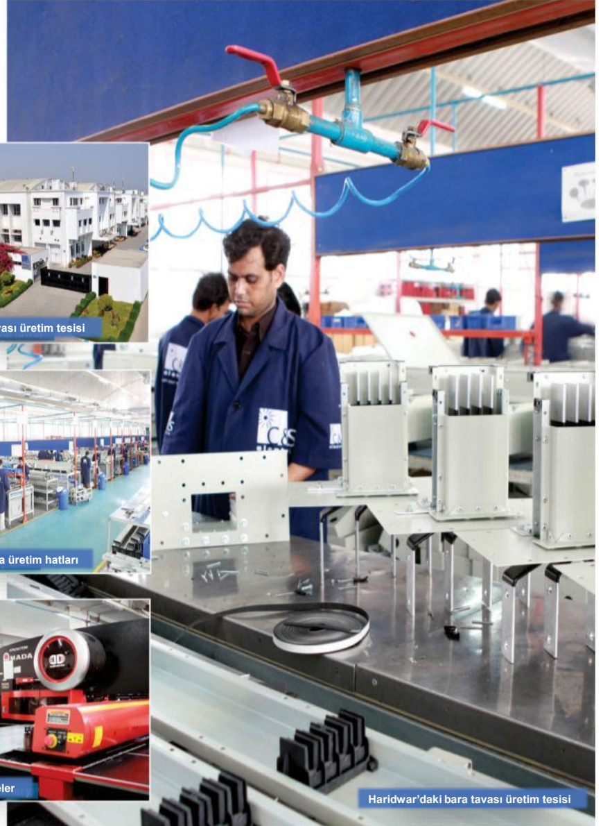
Haridwar'daki bara tavası üretim tesisi