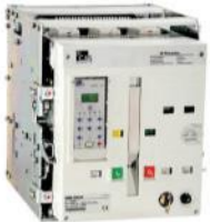
WINmaster Açık Tip Şalter