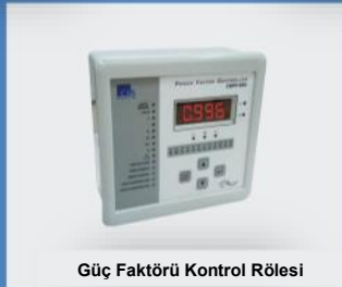
Güç Faktörü Kontrol Rölesi